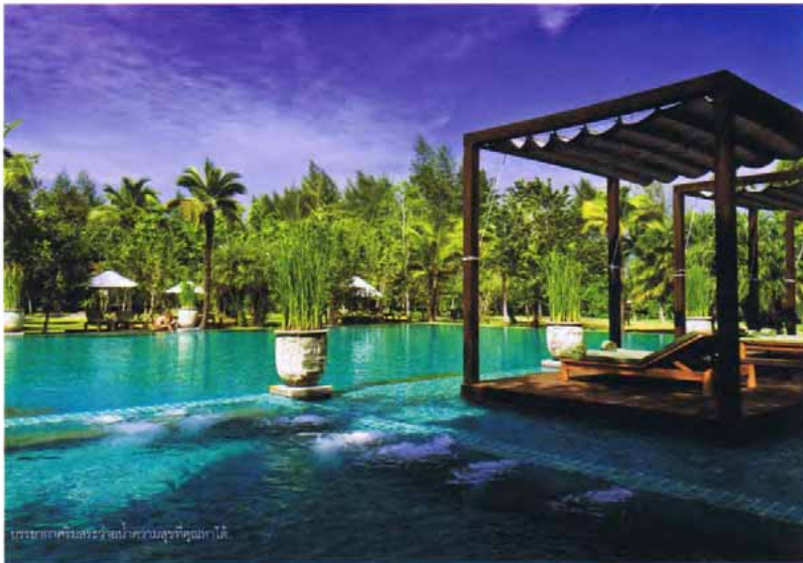
บรรยากาศสระว่ายน้ำให้ความรู้สึกสบายใจ