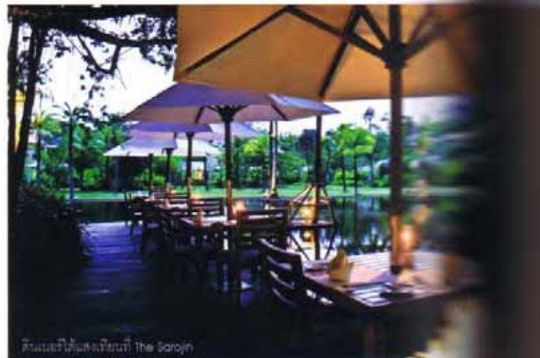
ดินเนอร์ใต้แสงเทียนที่ The Sarojin