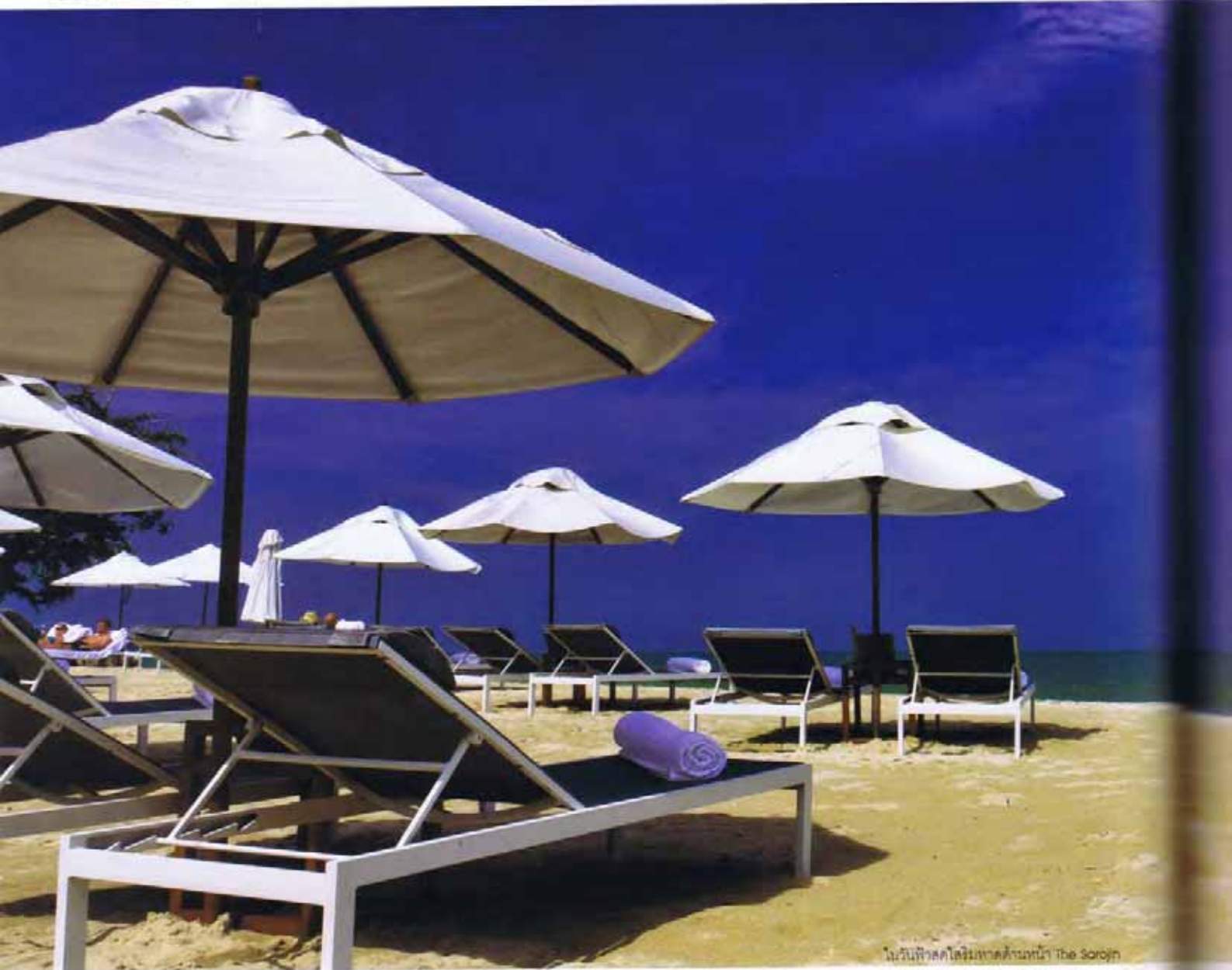
ในวันฟ้าสดใสริมหาดด้านหน้า The Sorojin