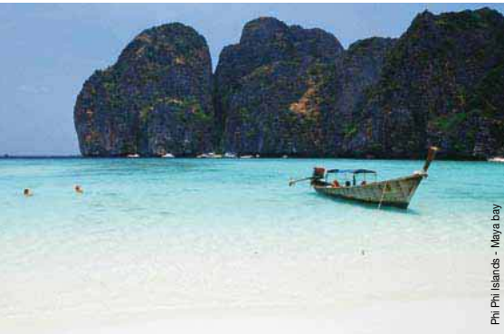
Phi Phi Islands - Maya bay The Tubkaak