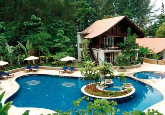
Tubkaak Les îles de Krabi