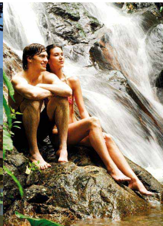
Een moment voor twee - The Sarojin