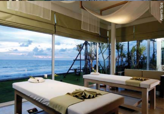
Aleenta Spa Le Tubkaak