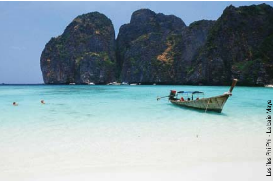
Les îles Phi Phi - La baie Maya Le Tubkaak