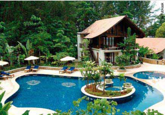
The Tubkaak Krabi Islands