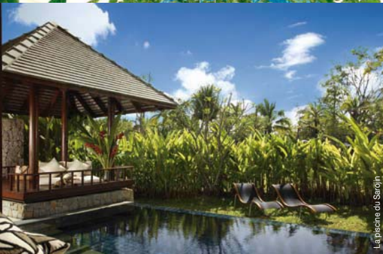
La piscine du Sarojin Aleenta