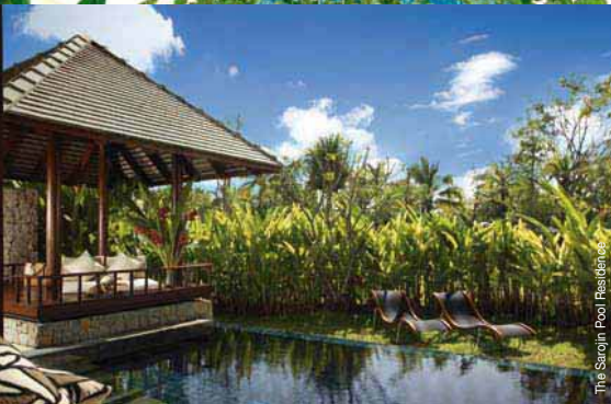
The Sarojin Pool Residences Aleanta