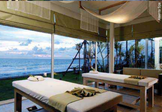
Aleanta Spa The Tubkaak